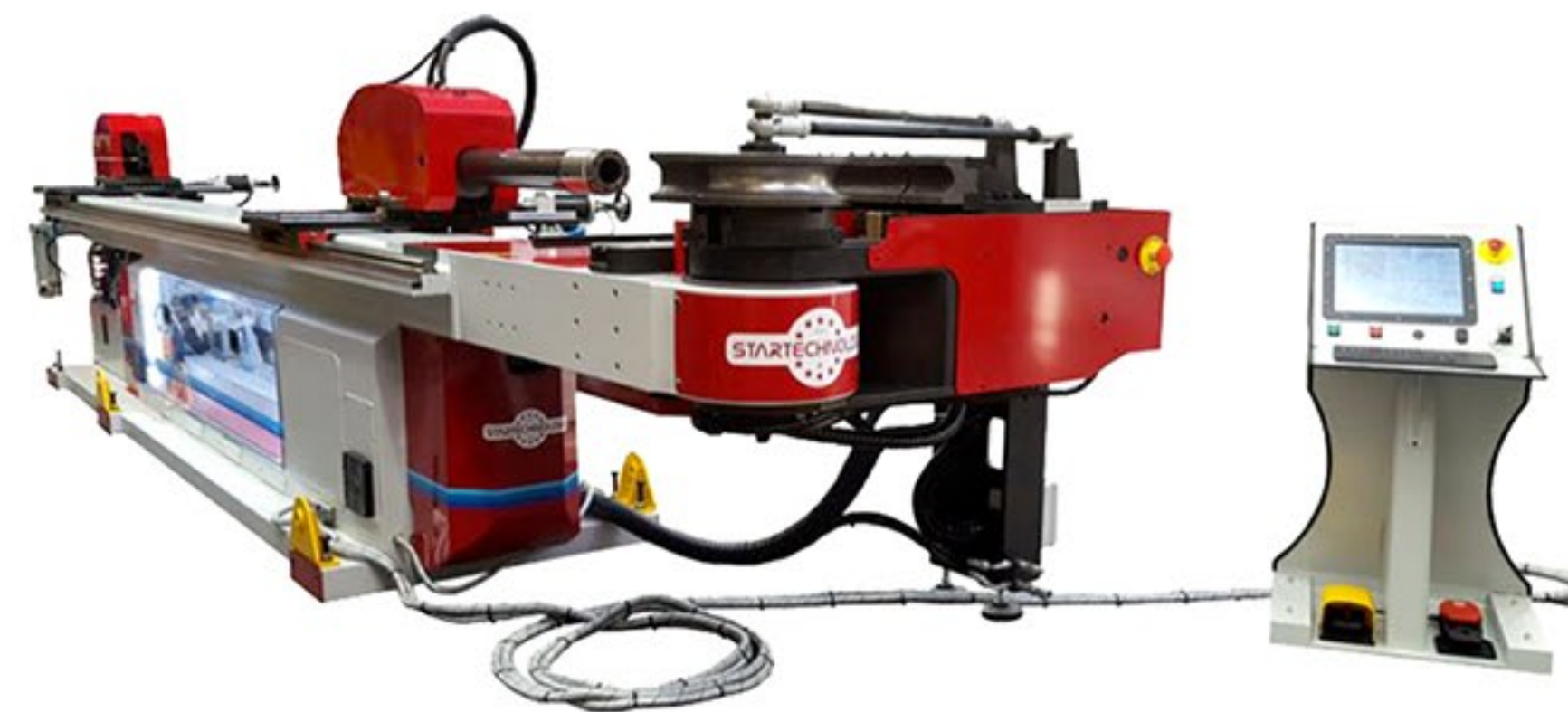
Giętarka trzpieniowa do rur STAR EVOBEND 380 CN3 PNEU