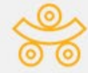
Gięcie rur i profili